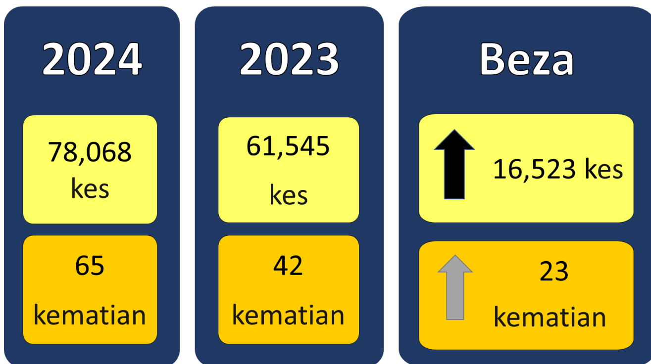
Gambarajah 2: Perbandingan kes dan kematian demam denggi sehingga Minggu Epidemiologi ke-27 tahun 2024 dan tempoh sama tahun 2023